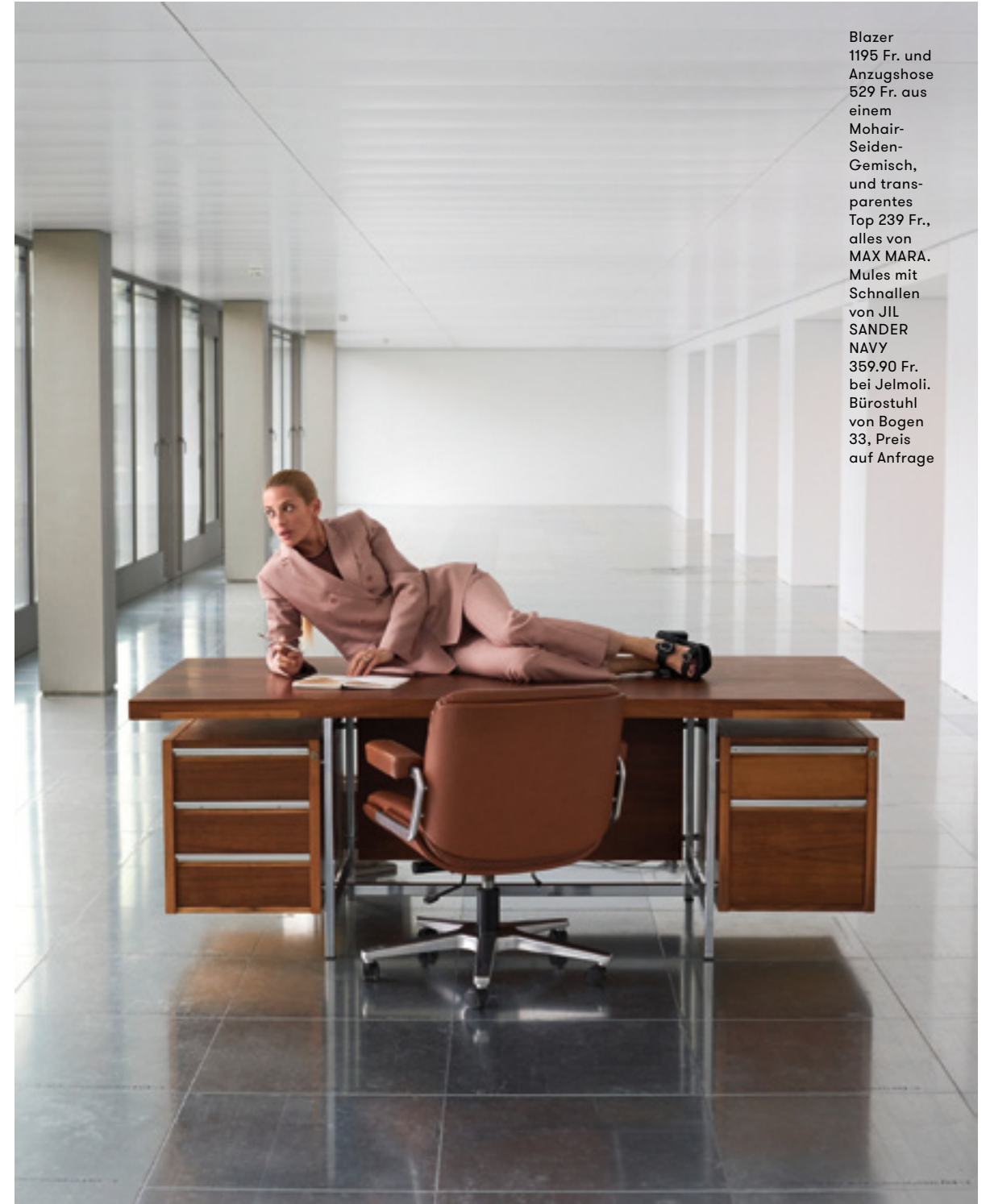
Blazer 1195 Fr. und Anzughose 529 Fr. aus einem Mohair-Seiden-Gemisch, und transparentes Top 239 Fr., alles von MAX MARA. Mules mit Schnallen von JIL SANDER NAVY 359.90 Fr. bei Jelmoli. Bürostuhl von Bogen 33, Preis auf Anfrage