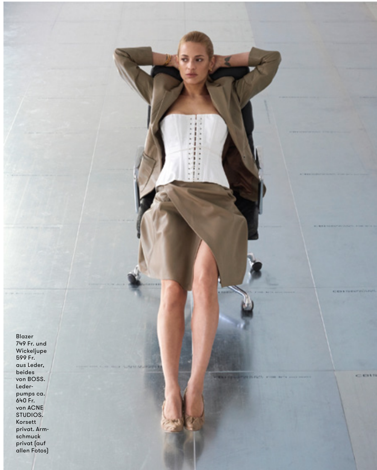
Blazer 749 Fr. und Wickeljupe 599 Fr. aus Leder, beides von BOSS. Leder- pumps ca. 640 Fr. von ACNE STUDIOS. Korsett privat. Arm- schmuck privat (auf allen Fotos)