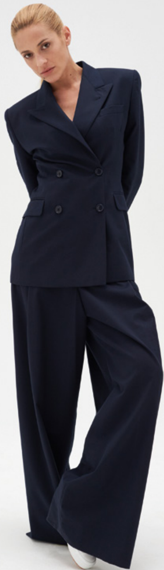
Taillierter Blazer mit Schulterpolstern ca. 920 Fr. und weite Anzughose ca. 570 Fr., beides von DRIES VAN NOTEN. Sneakers von SUPERGA 79 Fr. bei Pomp It Up