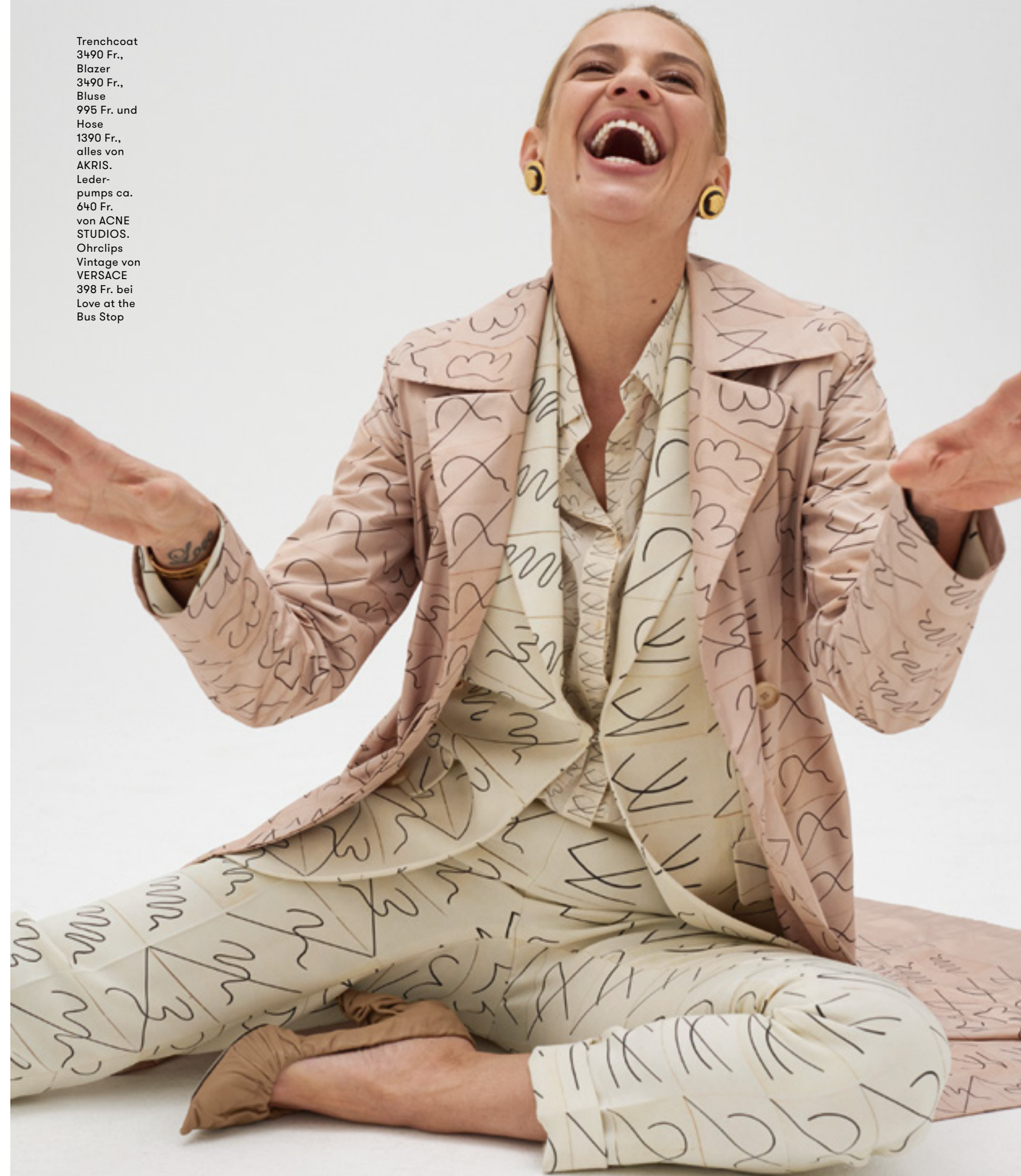
Trenchcoat 3490 Fr., Blazer 3490 Fr., Bluse 995 Fr. und Hose 1390 Fr., alles von AKRIS. Leder- pumps ca. 640 Fr. von ACNE STUDIOS. Ohrclips Vintage von VERSACE 398 Fr. bei Love at the Bus Stop